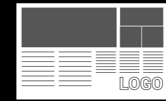
2/1 Seite oder 1/1 Seite 480 x 320 mm oder 240 x 320 mm